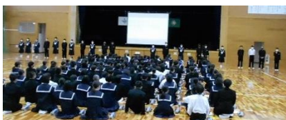
部活動紹介の様子